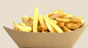
SAUCISSE ou NUGGETS - FRITES